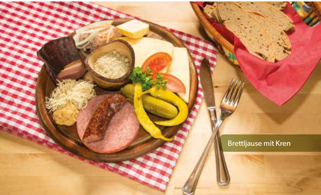
Brettljause mit Kren