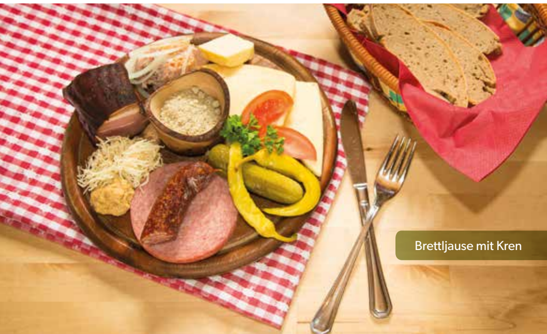
Brettljause mit Kren